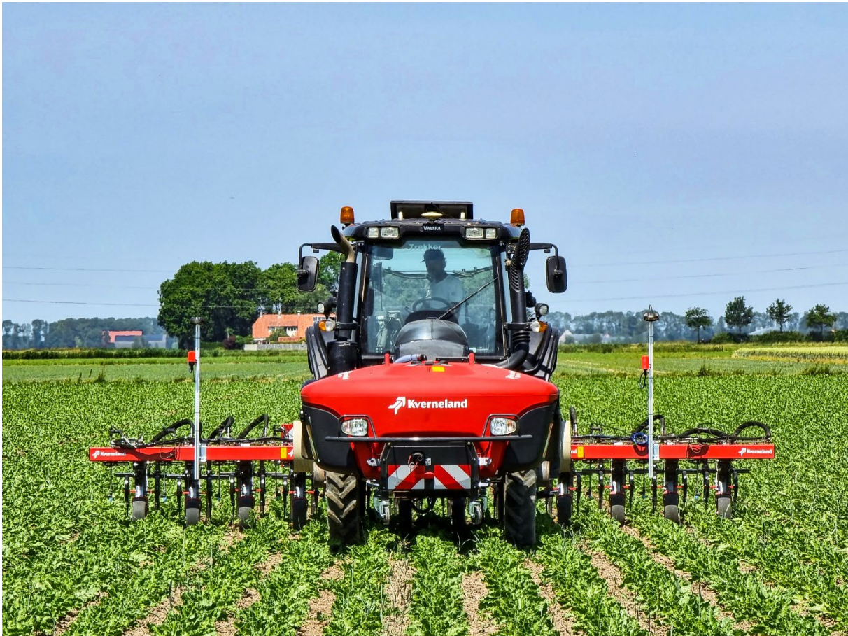
Sistemi combinati in fase di sviluppo: Kverneland Onyx con iXtra LiFe