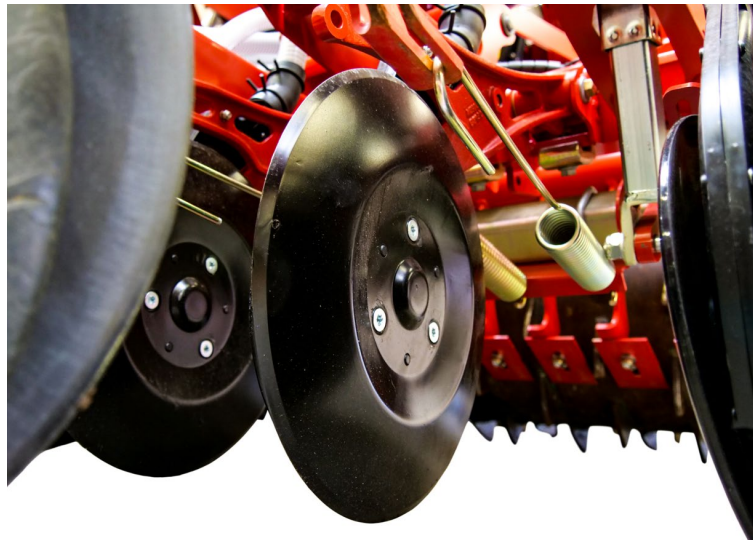
Kverneland f-drill CB F con CX-II senza press wheel

La profondità e la pressione di semina possono essere regolate attraverso distributori idraulici o monitor ISOBUS. Un nuovo sistema a sgancio rapido della barra riduce i tempi morti in caso di utilizzo dei nuovi ROTAGO F in solo.