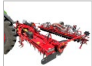
Kverneland f-drill CB F connessione