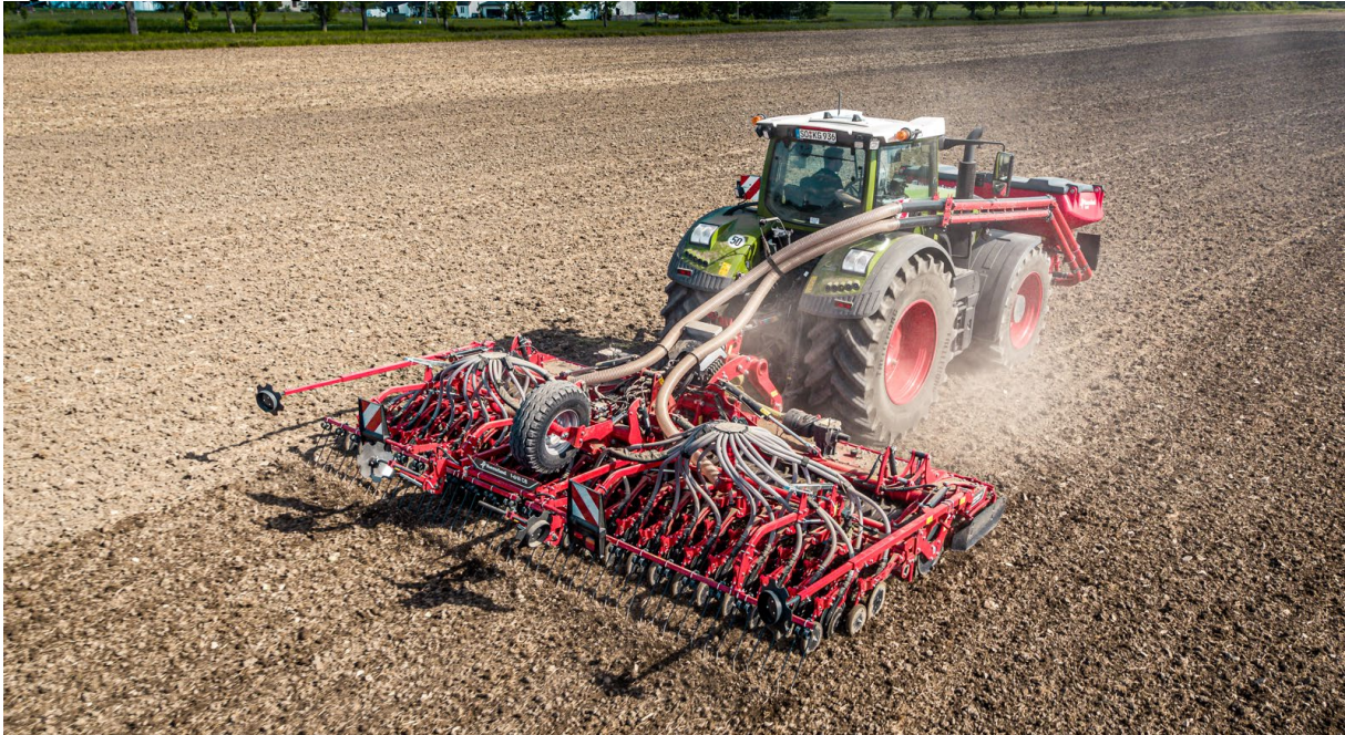
Kverneland f-drill CB F & Rotago F & f-drill – ready for the future, farming 4.0

Agosto, 2023: Castiglione Delle Stiviere