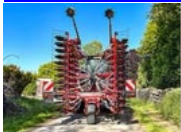
Kverneland ruota supporto