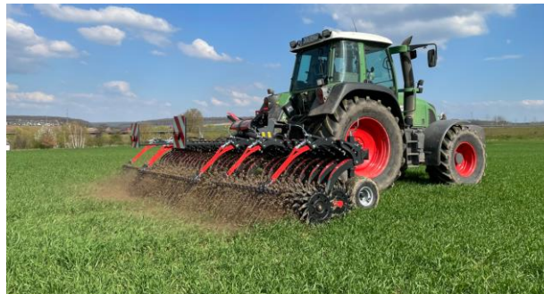
Kverneland Helios 1060 F

Eine effiziente Beikrautregulierung ist Voraussetzung für ein gesundes Pflanzenwachstum als Grundlage für Ertrag und Gewinn sowie für eine sichere Lebensmittelproduktion. Gleichzeitig ist der Schutz der Umwelt zu einem zentralen Thema in der heutigen Landwirtschaft geworden.