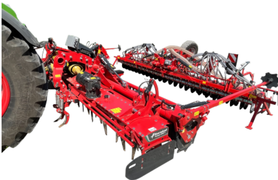
Kverneland sejací stroj f-drill CB F s jednoduchým CAT. II pripojením

Nastavenie hĺbky a prítlak bodky možno ľahko prispôbiť pomocou hydrauliky alebo vo verzii ISOBUS prostredníctvom terminálu. CAT. II umožňuje rýchle spojenie s rotačnými bránami ROTAGO F. Správna povrchová úprava je zabezpečená s prstovými bránami.