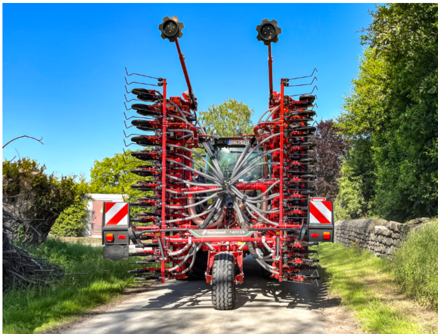
Kverneland sejací stroj f-drill CB F v prepravnom režime s oporným kolieskom

Pre lepšie vyváženie a dodatočnú stabilitu je k dispozícii oporné koleso, ktoré možno namontovať na sejačku. Nie je potrebné odpojenie horného závesu. Konštantná oporná sila na kolese zabezpečuje plynulý chod, zákonnú prepravnú hmotnosť, zvyšuje bezpečnosť a pohodlie vodiča.