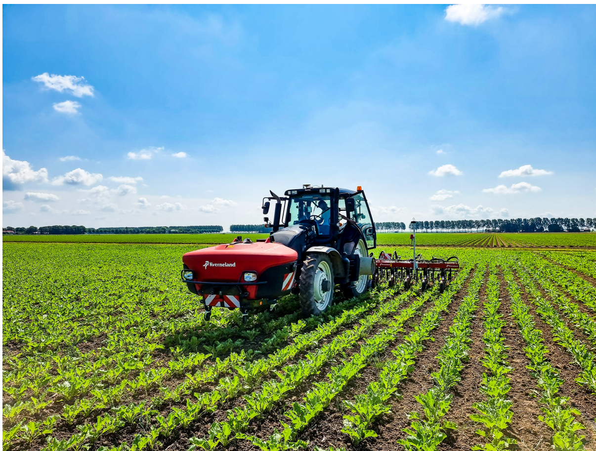
Kombinované systémy vo vývoji: Kverneland Onyx s iXtra LiFe

S odborníkmi z Centra Excellence Kverneland pre ošetrovanie plodín a sejacie zariadenia skupina Kverneland hneď od začiatku naplno pracuje na ďalšom vývoji. Ponuka kompletnej kombinácie strojov od jedného dodávateľa zabezpečí úplnú kompatibilitu a jednoduchosť obsluhy.