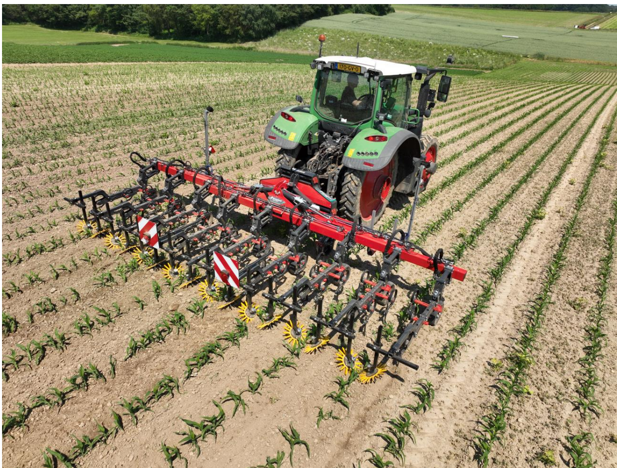
Cultivador entre filas Kverneland Onyx con cabezal auto alineado Lynx