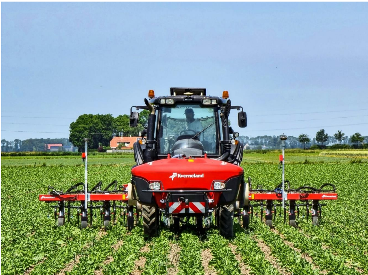
Sistemas combinados en desarrollo: Kverneland Onyx con iXtra LiFe

El Onyx y el Lynx estarán disponibles a partir del 1 de septiembre de 2023.