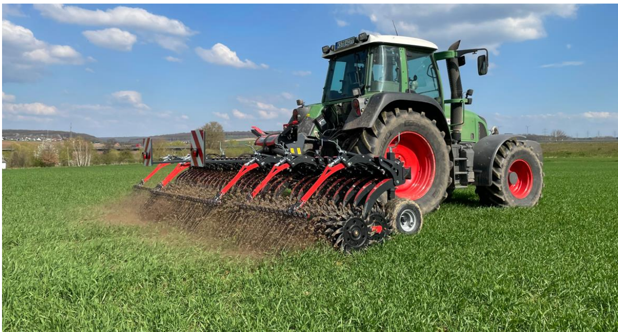
Kverneland Helios 2060 F

Efficiënte onkruidbestrijding is nodig voor een gezonde plantengroei als basis voor opbrengst en winst, en voor een veilige voedselproductie. Tegelijkertijd is de bescherming van het milieu een belangrijk onderwerp geworden in de hedendaagse landbouw. Met de Farm to Fork-strategie hebben recente Europese regels en beleid nieuwe normen gedefinieerd en de toegestane soorten componenten beperkt.